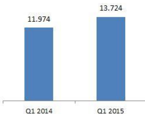
Proizvodnja sirove nafte (boe/d)