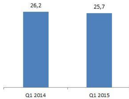
Omjer duga i kapitala INA Grupe (%)